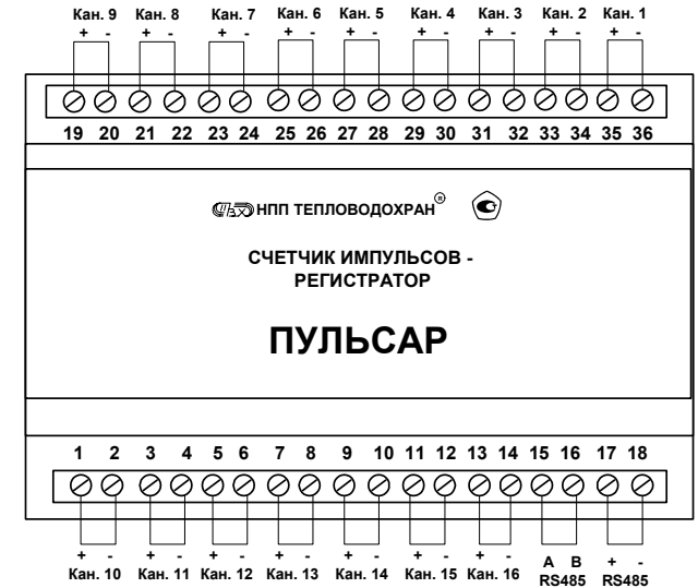
Рис. 6 Схема клеммников счетчика

Подключение активных выходных цепей должно производиться при отсутствии напряжения питания.