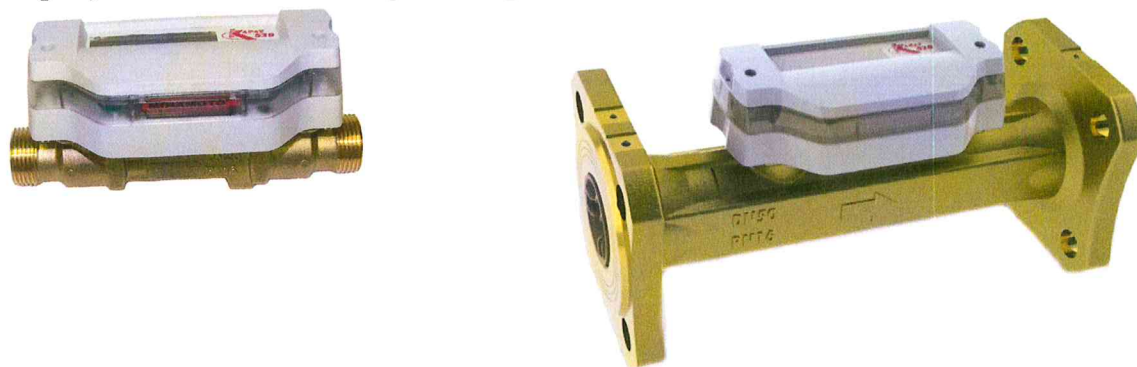
Рисунок 1 – Внешний вид расходомеров

Внешний вид расходомеров – счётчиков жидкости ультразвуковых КАРАТ-520 представлен на рисунке 1. Места пломбирования расходомера представлены на рисунке 2.