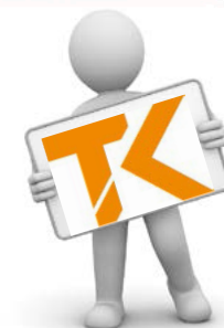
Менеджер коммерческого отдела

Незамедлительно направляет: – акт об установленном расхождении по количеству и/или качеству (ТОРГ-2 или ТОРГ-3), подписанный комиссией; – претензионное письмо (рекламация), – товарная накладная ТОРГ-12 с указанием возвращаемого товара.